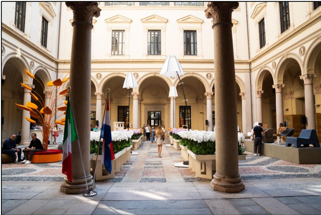
scorcio sulla corte di Palazzo Turati, Fuorisalone 2021

Siamo lieti di ospitare il Circolo Interprofessionale degli Architetti, Geometri e Ingegneri dell'Alto Milanese per un incontro dedicato ed un drink di piacere.